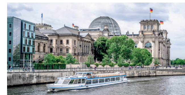
FEIERSTUNDE MITTEN IM ZENTRUM DER BUNDESHAUPTSTADT

In den Kategorien Behindertenfußball, Resozialisierung, Schule und Verein sowie „Fußball Digital“ werden je drei ausgewählte Vorschläge mit einem Geldpreis prämiert (1. Platz/5.000 Euro, 2. Platz/3.000 Euro, 3. Platz/2.000 Euro). In der Kategorie „Sozialwerk“ wird der mit 5.000 Euro dotierte „Horst-Eckel-Preis“ vergeben.